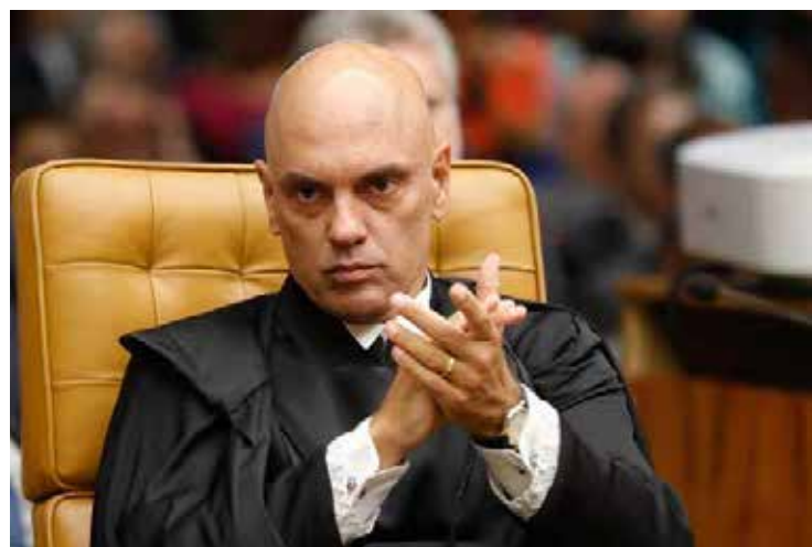
Alexandre de Moraes: materialidade do crime ficou comprovada

Moraes defendeu que a materialidade do crime ficou provada. “O réu foi preso em