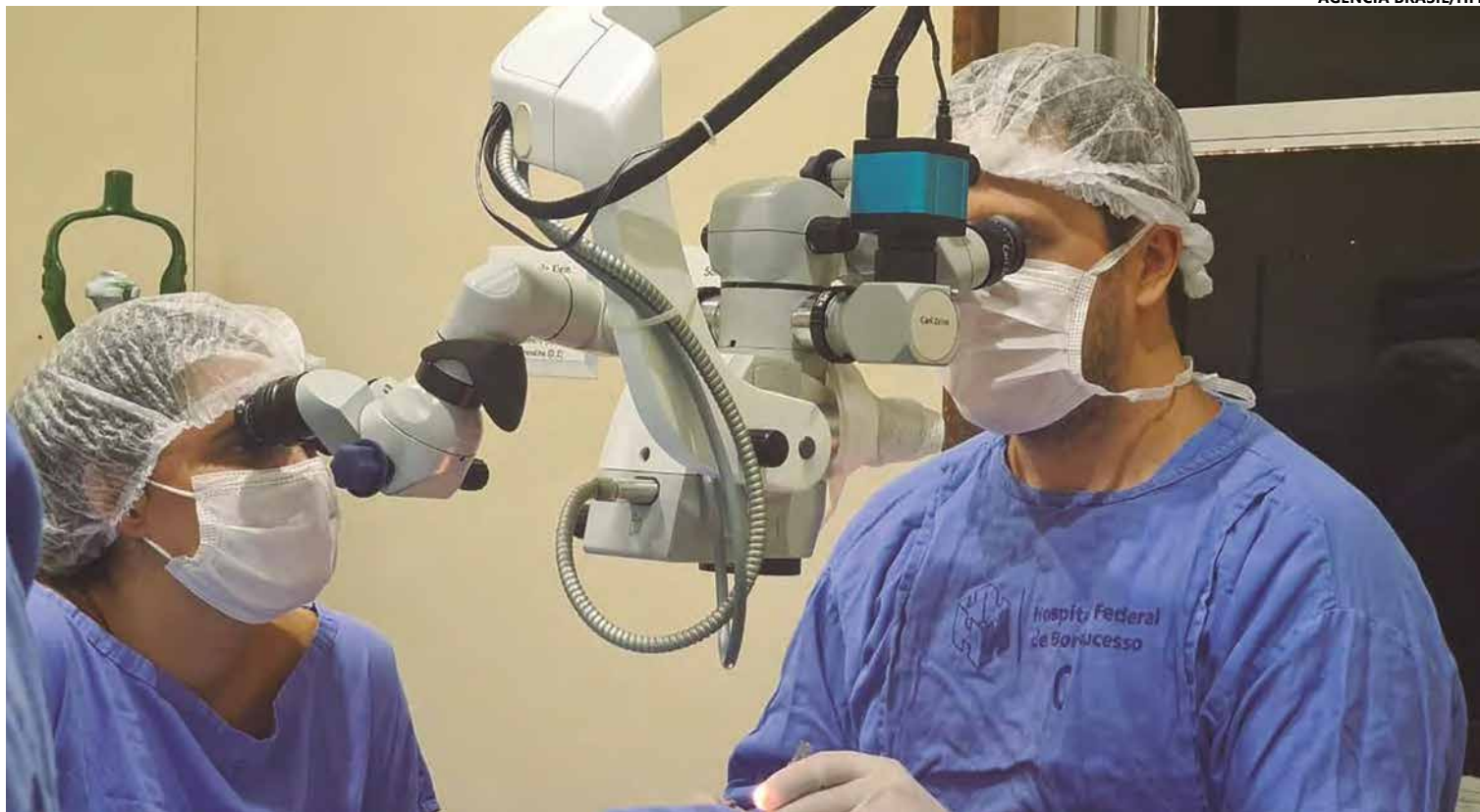
Hospital de Olhos Camargo Zambrin, o Grupo Doma e o Hospital Oftalmológico, instituições especializadas, realizam os procedimentos na cidade

Apesar do aumento de 48% no número de doadores de córneas, a SES enfatizou a impor-