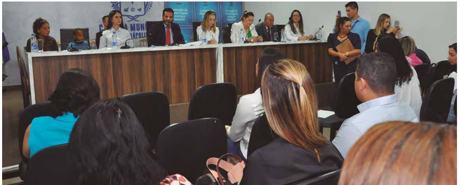
Tratativas foram coordenadas por representantes da Câmara, da Prefeitura e das entidades que defendem os direitos da criança no município