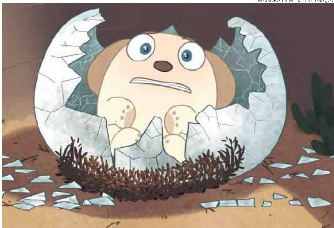
Resiliente: personagem de filme goiano luta para descobrir passagem secreta

Esse é o primeiro trabalho cinematográfico que exige fôlego realizado pela produtora goiana Mandra Filmes. Para