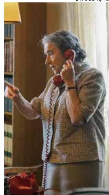
Dama de ferro: Helen Mirren interpreta política importante da história de Israel

“Golda - A Mulher de uma Nação” é um bom e adulto filme político. Mas, como, político? Não se trata da Guerra do Yom Kippur? Sim, mas como dizia Clausewitz, a guerra é a continuação da política por outros meios.