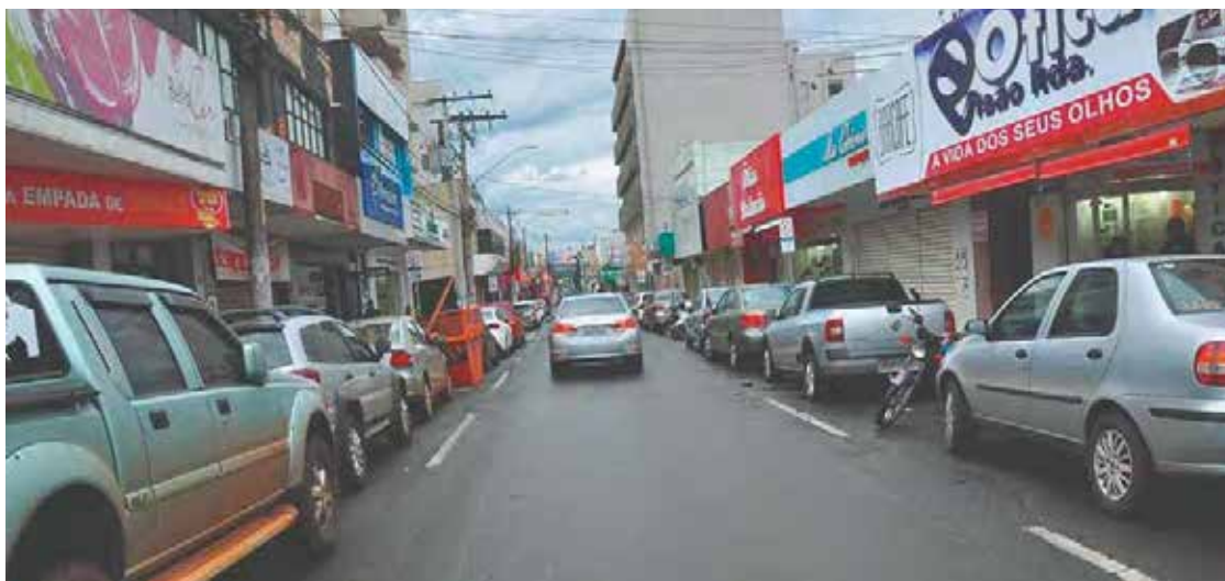
Votação ocorre via aplicativo da CDL; vencedores recebem homenagens em evento no dia 25 de novembro

participação do público, a CDL fará 20 sorteios, dos quais 19 são de vale-compras de R$ 300 cada. Ao todo, serão R$ 50 mil em prêmios, de acordo com a entidade. Também há sorteios