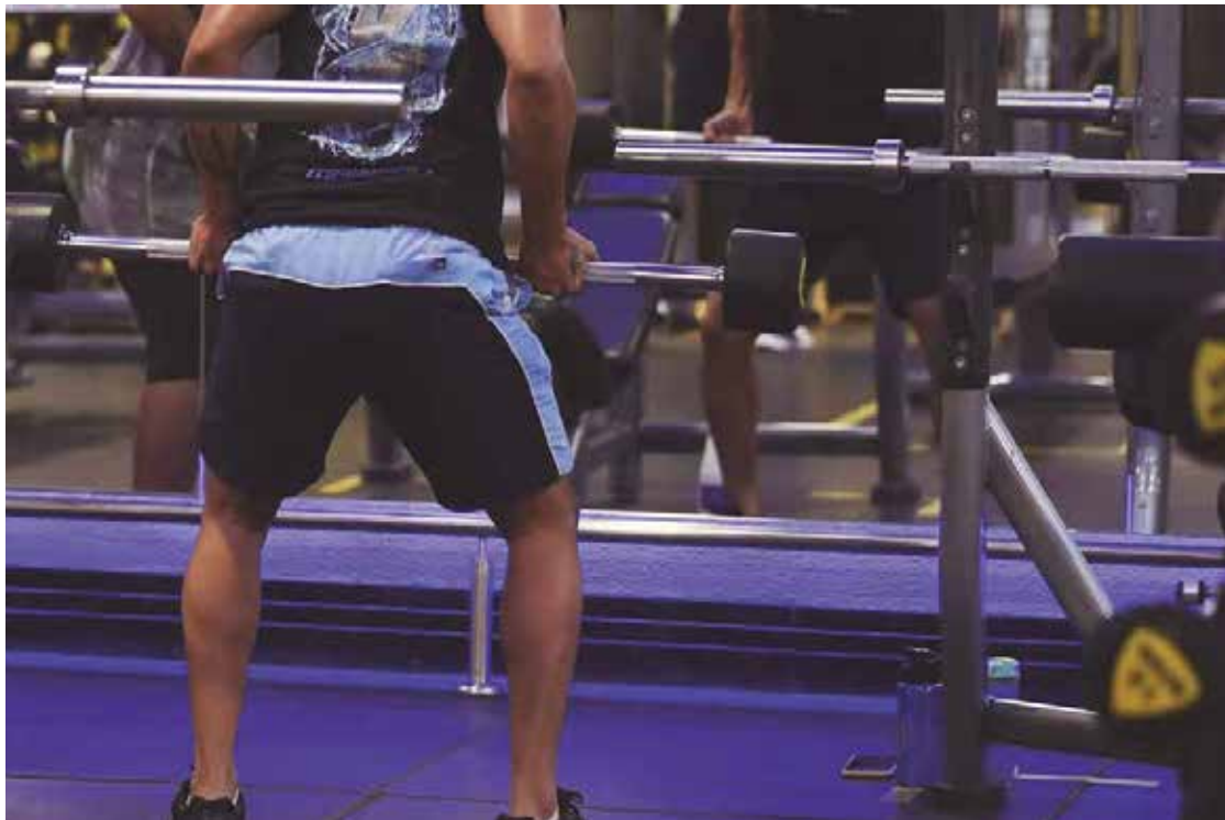
Segundo especialista, exercícios físicos não devem ser punitivistas ou puramente estéticos, mas sim prazerosos