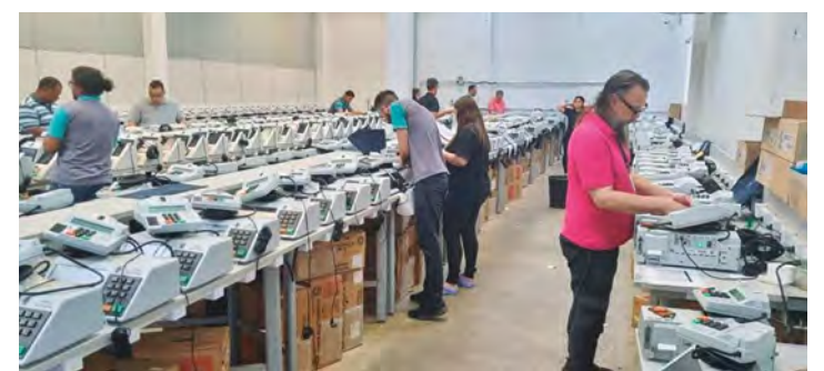
Em 213 cidades, 628 locais de votação contam com 2.787 urnas

Assim que forem feitos a carga e lacre, as urnas serão transportadas pelo TRE do Depósito Central de Goiânia aos cartórios eleitorais entre 18 e 22 deste mês. Os conselhos retirarão as urnas prontas entre os dias 25 e 29. A devolução, no mesmo cartório, poderá ser feita até o dia 3 de outubro. A Secretaria de Tecnologia da Informação (STI) e a CSEL darão suporte aos conselhos na véspera e no dia das eleições.