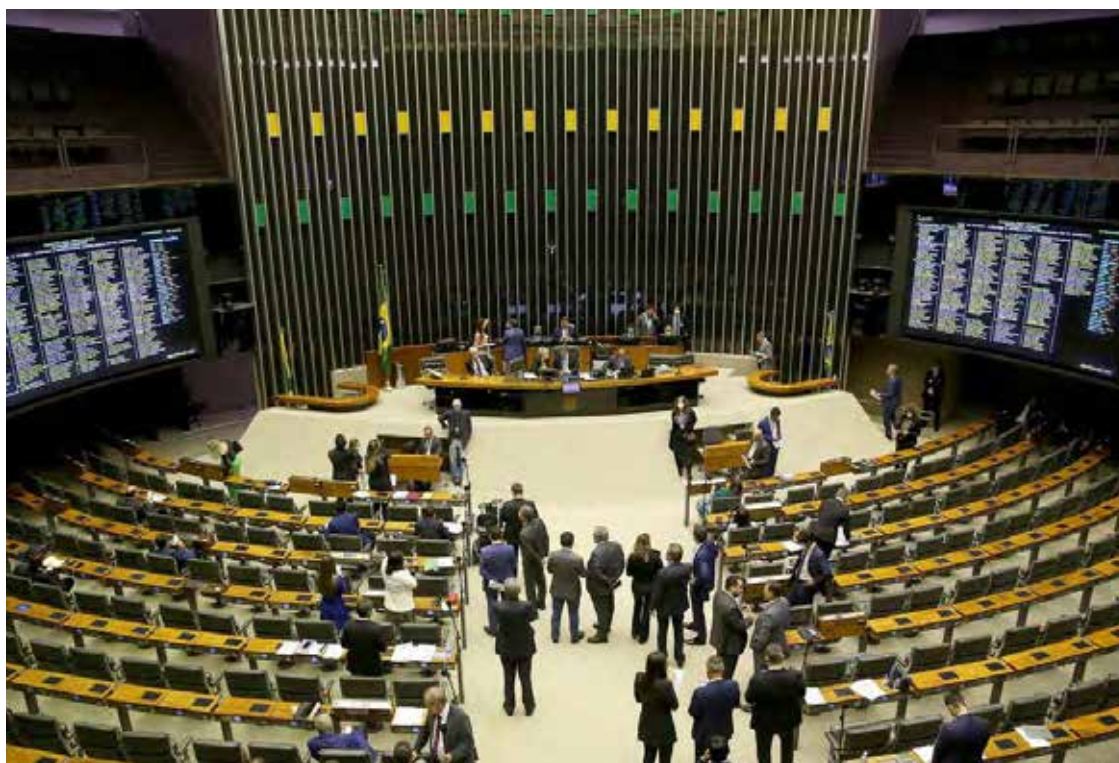
Plenário da Câmara dos Deputados: reação à desapropriação de terras produtivas

O objetivo do projeto, dizem os deputados, é garantir que terras produtivas – isto é, já utilizadas para agricultura e pecuária – não sejam desapropriadas pelo governo para a reforma agrária. Em caso de desapropriação, o governo paga