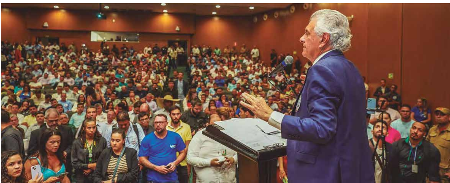
Governador Ronaldo Caiado ouviu dos prefeitos pedido para que não haja descontos 'na boca do caixa' de repasses de ICMS, também afetado