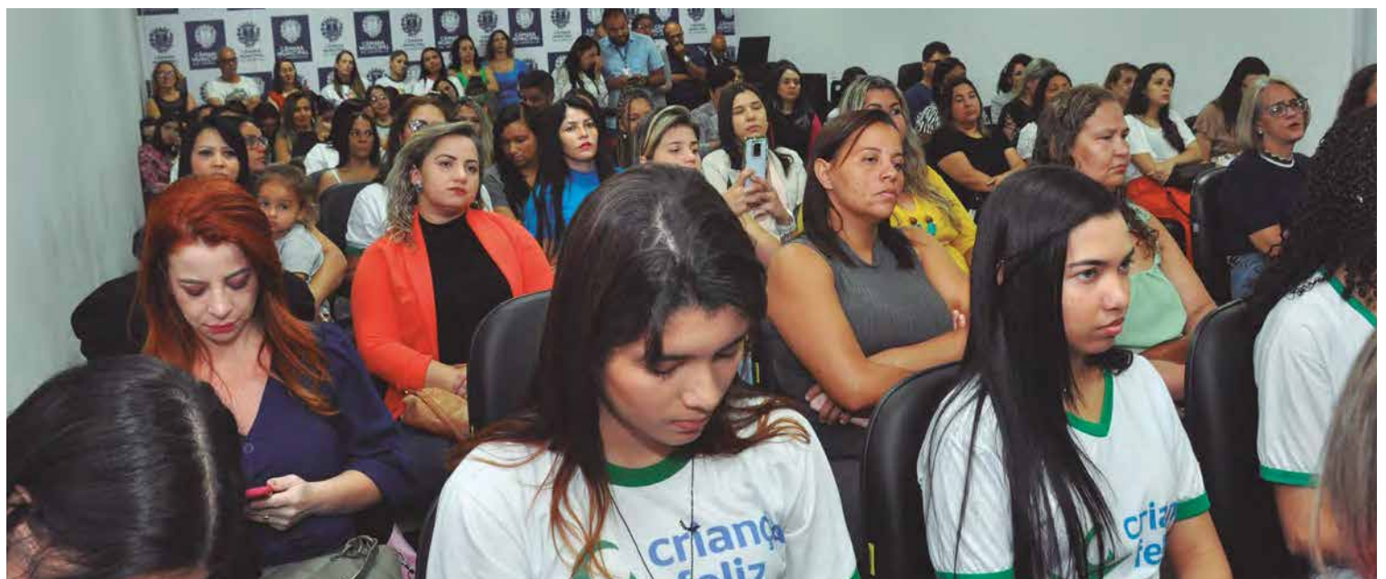
O miniauditório da Câmara ficou lotado, todos tiveram oportunidade de influenciar nos debates e colaborar com início da elaboração do PMPI