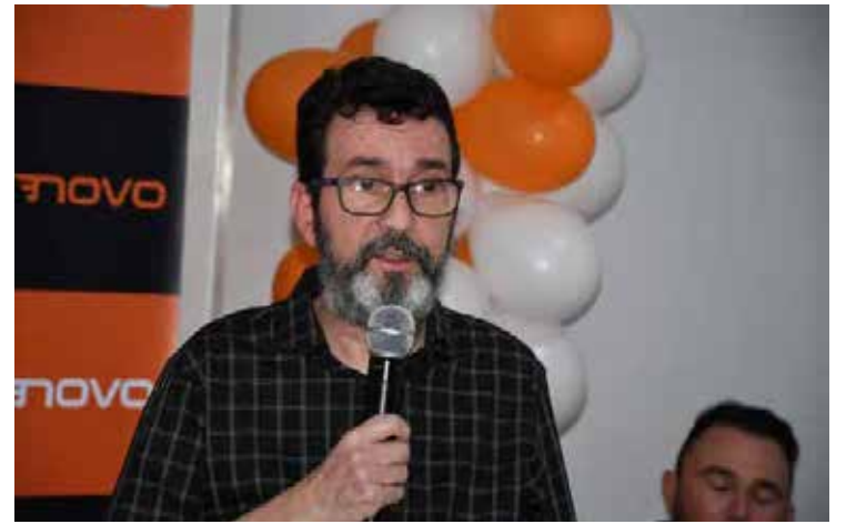
Adriano Sarmento: direção