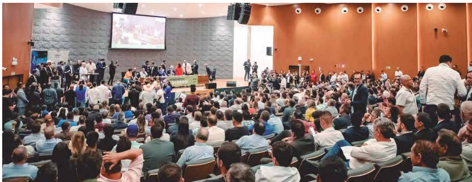
Gestores municipais lotaram auditório na Alego, em Goiânia, defenderam união de forças em busca de mais recursos junto ao governo federal

Segundo o governador, "o estado já não suporta o que está tendo que pagar sem receber", uma vez que, mesmo sem a receita, é obrigado a pagar 25% do valor da compensação aos municípios. "Sentemos à mesa, vamos discutir e avaliar para buscar al-