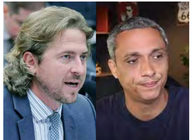
Zeca Dirceu (PT)