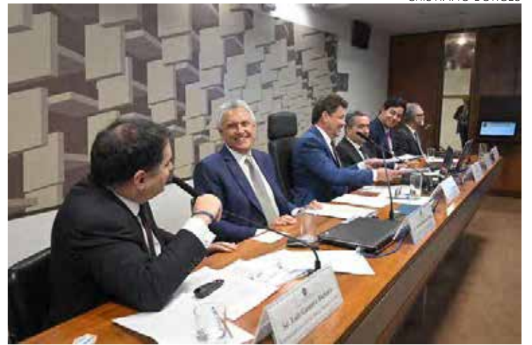
Governador Ronaldo Caiado em audiência pública no Senado Federal: alerta para prejuízos de estados

“O modelo que queremos não pode ser pensado como um Cavalo de Tróia, que traga embutido aumento de carga e em determinado ponto uma limitação dos entes federativos conforme trazido pelo Caiado”, considerou o senador Efraim Morais Filho (PB). “Sou contra a reforma tributária, não tenho dúvida em falar isso”, destacou o senador